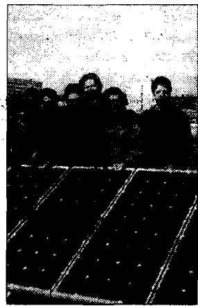
Tempo di fotovoltaico