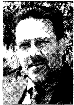
Critico Fratellini, Fl