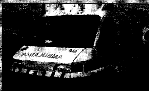
Niente da fare Sul posto il 118

ASSISI (v.a.) - È stato trovato morto nel pomeriggio di ieri un uomo residente a Torchiagina. L'assai, di 48 anni, è stato scoperto privo di vita all'interno della sua abitazione, ubicata nel centro del paese. Si era privo di vita sul suo letto. Molto probabilmente il decesso è stato frutto di cause naturali, anche se al momento gli inquirenti non si sbilanciano più di tanto, visto che sono stati disposti ulteriori esami. Si escludono comunque responsabilità di reato. Nella frazione l'uomo era molto conosciuto e amato dai tutti.