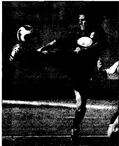
Tanto agonismo ieri in campo