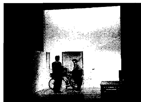
Il piccolo teatro degli Instabili