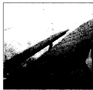
Il fotovoltaico Pannelli

tappezzando con adeguati pannelli solari anche le grandi superfici idonee della Montecatini che hanno una esposizione verso il Sud. Nell'arco di venti anni, in un territorio così eterogeneo come il nostro si potrà sfruttare energia nucleare, teleriscaldamento, fotovoltaico con enormi conseguenze positive per il territorio".