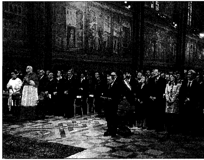
Tanti big e non solo Il patrono d'Italia omaggiato da tutti

Bettona. L'occasione per cercare una strada per bloccare la tragica spirale sarà la conferenza internazionale indetta da Cgil, Cisl e Uil che si svolgerà domani alla Cittadella, in occasione della giornata mondiale "Per un lavoro dignitoso - Diritto al lavoro, solidarietà e giustizia sociale nell'economia globale". Saranno presenti i leader nazionali delle sigle sindacali confederali. L'appuntamento è alle 10 e inizia con un titolo promettente, "Il sindacato incontra i giovani". A spiegare l'iniziativa ci penseranno i segretari generali Cgil Cisl e Uil Umbria, che saranno seguiti dal saluto delle autorità regionali e locali. Alle 10,30, si partirà con la presentazione della campagna mondiale sul lavoro dignitoso; il primo intervento in programma, "Diritti negati e democrazia, il ruolo dei sindacati", è di Raffaele