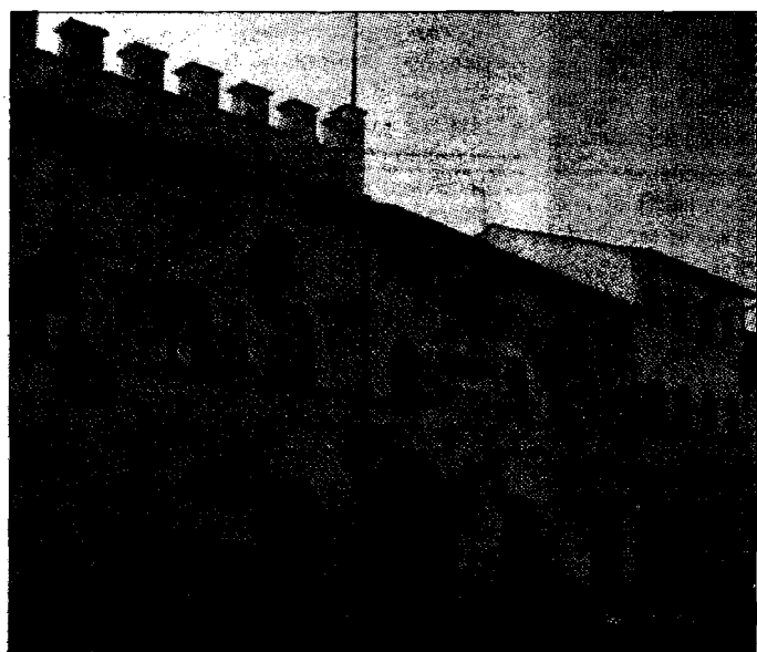
Comune La maggioranza divisa sulla casa di riposo

ni del consigliere della Mongolfiera, il primo cittadino si è impegnato a discutere entro la fine della seduta gli argomenti chiesti dal-