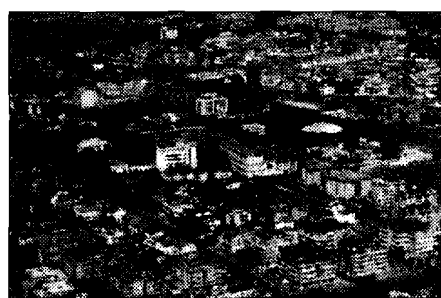
Dibattito Sul commercio bastiolo