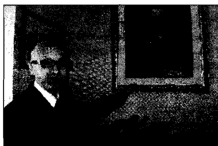
Il fatto Ritratto del sindaco podestà