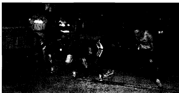
Il clou La lizza, momento magico