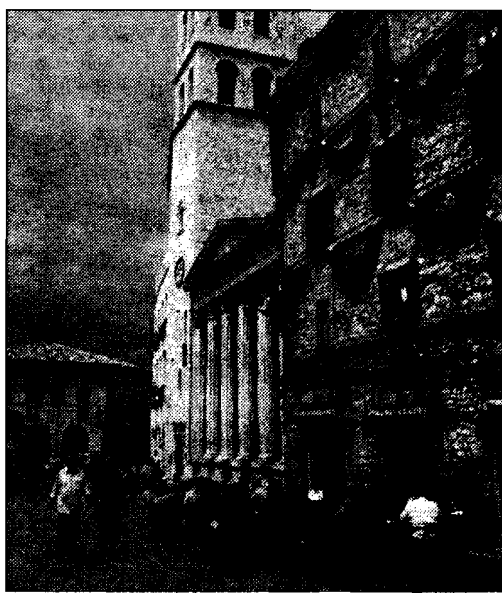
Viabilità Un problema aperto

Insomma, come si vede, il dibattito sulla viabilità continua a tenere banco e sembra di capire non finirà qui. Per questo l'amministrazione ha voluto spiegare la sua posizione invitando a pazientare per i disagi che si creano".