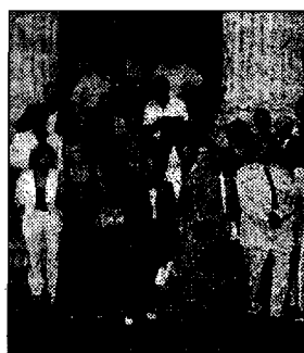
Insieme Quelli del '58