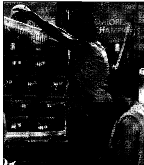
E intanto, al PalaEvangelisti... Prosegue in maniera incessante la preparazione della Rpa luigiBacchi.it