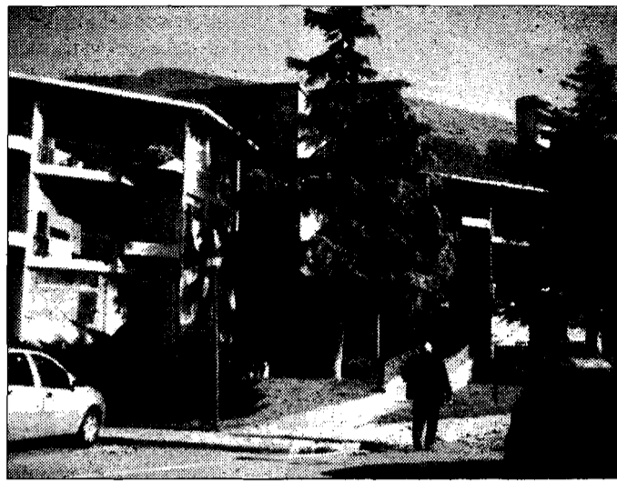
Ospedale di Assisi E' sempre bagarre politica