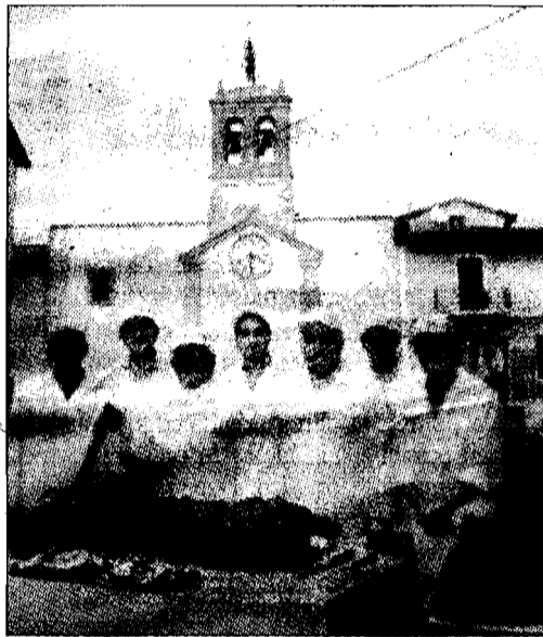
Porchettai i più bravi sono a Costano