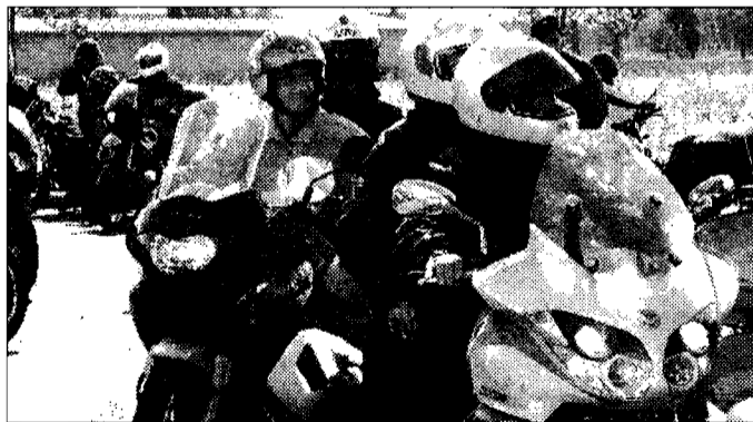
Festa Il motoraduno di Petrignano darà spettacolo

C'è il raduno internazionale di Petrignano Il "Giro dell'Umbria" si fa in moto dal 12 agosto