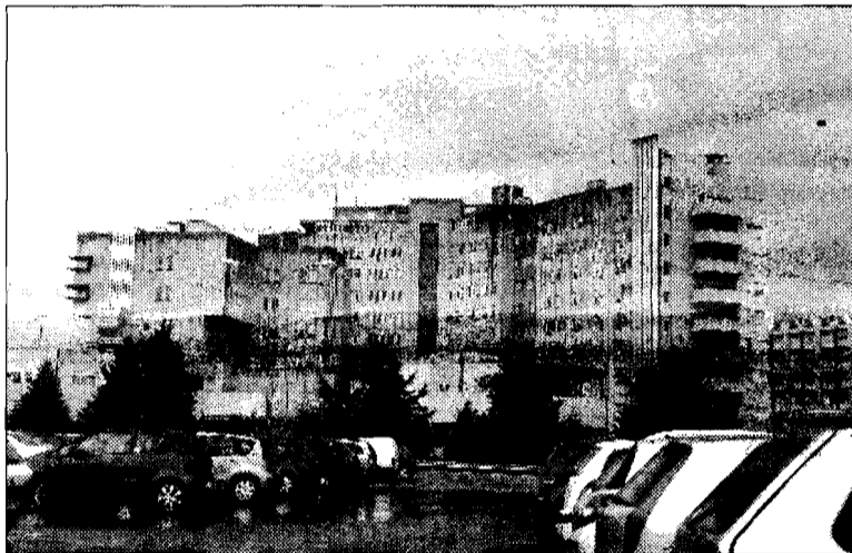
Ospedale Dopo le prime cure il ragazzo è stato portato a Napoli

elevato. Particolarmente lunga la ricerca di un posto letto nelle strutture specializzate; sono stati contattati i nosocomi di Cesena, Roma, Napoli e infine la struttura pediatrica Mayer di Firenze. Alla fine, intorno alla mezzanotte di martedì, il ragazzo è stato potuto trasferire al Centro ustionati gravi di Napoli. Con lui i genitori, arrivati già martedì pomeriggio da Foggia insieme ai congiunti dell'altra ragazza coinvolta per rendersi conto delle condizioni dei familiari. La ragazza è tuttora ricoverata all'ospedale di Perugia, mentre il suo compagno dovrà rimanere a Napoli fin quando non migliorerà sensibilmente.