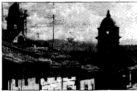
Novità Soldi anche per Cannara

ASSISI - Un pieno di energia (solare) nei comuni del comprensorio. Il progetto, a cui aderiscono 28 comuni della provincia, si chiama "1000 tetti fotovoltaici". La società Sienergia ha pubblicato un bando per l'erogazione di alcuni contributi per la realizzazione di sistemi fotovoltaici di potenza di 3 kw collegati alla rete del distributore locale di energia elettrica, pannelli sufficienti per un'abitazione. Partecipare è possibile inoltrando le domande a Sienergia entro il 15 settembre. Per qualunque informazione si può visitare il sito www.siennergiaspa.it . Da Assisi, però, il Comune consiglia di affrettarsi, perché solo i primi 68 impianti saranno totalmente finanziati. "E' una importante opportunità - ha