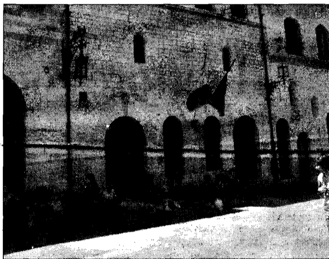
Palazzo comunale Impegnativo dibattito estivo