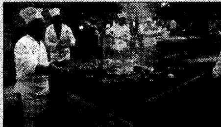
Sagra Oca protagonista a Torchiagina

ASSISI - E' cominciata ieri sera, e durerà sino a domenica tre agosto, la ventunesima edizione della "Sagra dell'oca arrosto", tradizionale appuntamento organizzato dalla Pro Loco e Circolo Acli Torchiagina di Assisi, della "Settimana gastronomica Torchiaginese", giunta quest'anno alla sua trentaseiesima edizione.