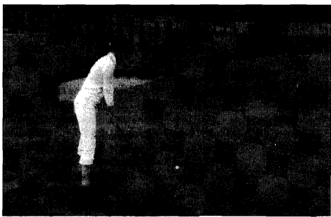
Signore in gara Il torneo "misto" è molto avvincente

Golf Trofeo in notturna: ecco le coppie Prime sfide per "Adamo ed Eva" sul green illuminato del Caldese