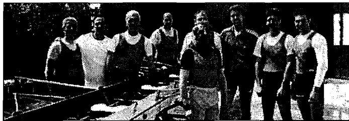
Posillipo L'otto master della società partenopea in gara a Piediluco