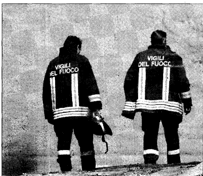
Vigili del fuoco Lungo intervento di tre ore in via Bartolo

ASSISI - Momenti di paura a Santa Maria degli Angeli per una consistente fuoriuscita di gas da un condotto. Conseguenze più gravi avrebbero potuto verificarsi se i vigili del fuoco del distaccamento di Assisi non fossero intervenuti in un breve lasso di tempo. L'allarme è scattato poco prima delle 11 in via Bartolo, nella zona della frazione angelana che si trova a pochi metri dal nuovo svincolo Anas (zona ex Icap). Stranamente, a pochi passi dall'azienda delle fonderie officine meccaniche Tacconi, dove solo qualche giorno fa è stato registrato un altro allarme per una fuga di ossigeno. Ieri mattina, però, a causare la consistente perdita è stato un problema a una valvola; il tubo si è rotto proprio durante i lavori per lo svincolo. L'intervento di contenimento è iniziato subito e ha richiesto ben tre ore di attività. Si è provveduto a chiudere le condutture di media pressione; per evitare spiacevoli sorprese, e per maggiore sicurezza dei cittadini, si è ritenuto necessario chiudere il metanodotto fino al ritorno alla piena normalità. Non c'è stato invece bisogno di procedere all'evacuazione delle abitazioni. Tuttavia, la perdita di gas, benché gestita con prontezza, è stata di entità decisamente consistente e potrebbe ancora produrre conseguenze. Il sindaco e la società Assisi gestione Servizi Srl, che distribuisce e gestisce la rete, hanno diramato una nota per i cittadini utenti di Santa Maria, Assisi, Vi-