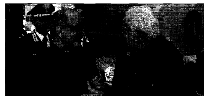
In visita L'arrivo del senatore a vita