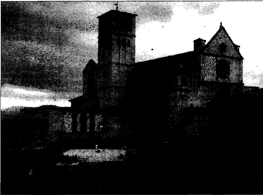
La basilica in una foto datata in occasione della visita del Papa