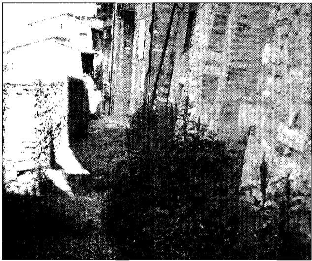
Erba alta in centro E' la situazione di alcuni vicoli