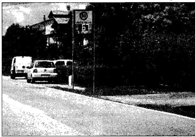
Nuovi rilevatori di velocità Per i cittadini sono pochi

A furor di popolo infatti, Ospedalichio è una delle zone di Bastia