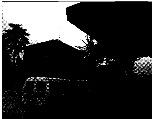
Acque agitate Tassisti all'uscita della stazione

ASSISI (f.p.) - Detto che la maggior parte dei tassisti sono onesti, tra i guidatori di auto bianche di Assisi ci sarebbe qualche autista meno onesto degli altri: la segnalazione, fatta anche in Comune nel corso di alcuni incontri tassisti/amministrazione, arriva da alcuni conducenti di taxi, secondo cui altri colleghi applicherebbero delle tariffe non conformi a quelle scritte in italiano, inglese, francese e tedesco nei vari cartelli affissi per la città.