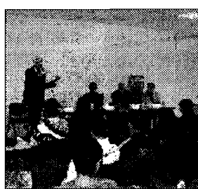
In tanti all'incontro