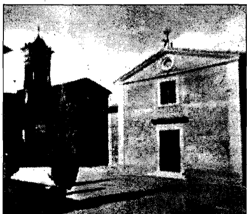
Tordandrea Immagini e ricordi

ASSISI - Si conclude oggi la bella mostra fotografica su Tordandrea, piccola e graziosa frazione assisana. L'esposizione, inaugurata ieri, sarà aperta anche oggi dalle 9 alle 20 presso la ex scuola elementare di Tordandrea.