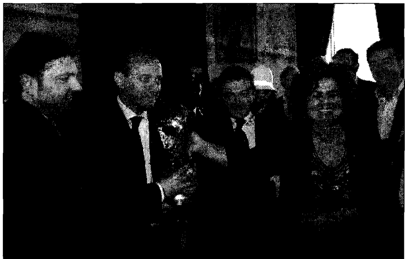
Giornata storica Nuova ribalta mediatica per la città serafica

La giornata è stata di grande soddisfazione per tutta l'amministrazione comunale di Assisi, che dalla vittoria del 2006 ha fatto richiesta della coppa dei mondiali,