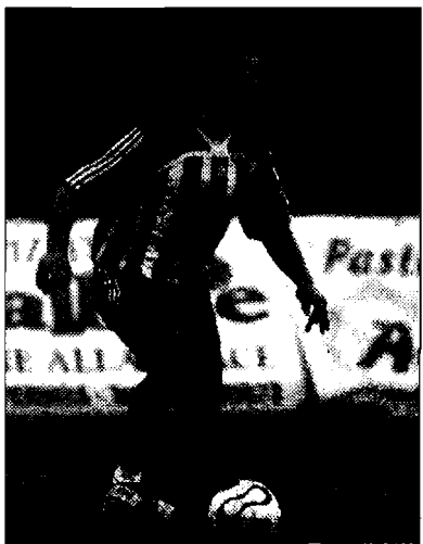
Ambito In tanti su Miani