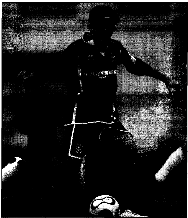
Capitano Marinacci potrebbe lasciare Deruta