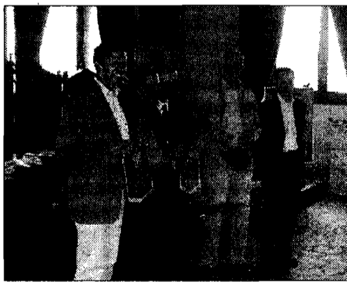
Ospiti La delegazione da Bayreuth

"Uniti da consolidato spirito di amicizia - si legge in un comunicato a firma dell'ampministrazione comunale - questi giovani si scambiano visite nel nome dei veri valori dello sport: sono agonismo, amicizia, dialogo, fratellanza". Un'opportunità per rinsaldare dunque i legami di amicizia con la delegazione in visita.