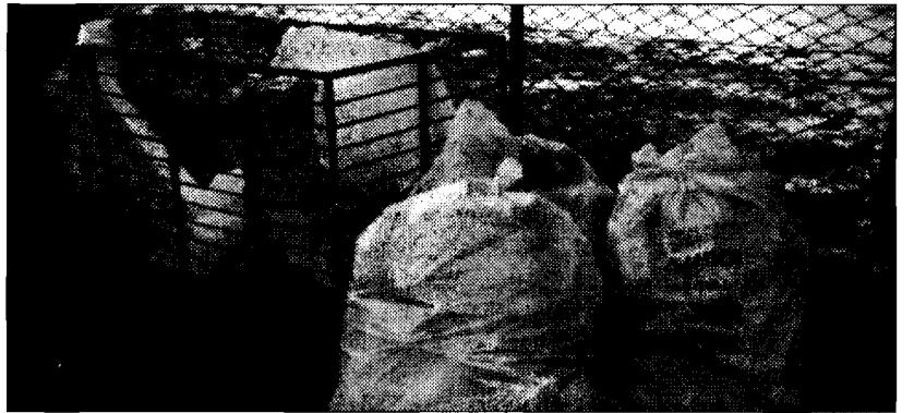
Rifiuti Per promuovere la raccolta differenziata

ne ecologica del Ponte Rosso. Ritengo che le ditte siano tra i maggiori produttori di materiale di recupero, come carta, cartone, ferro, legname, vetro e altro e quindi, proprio per questo motivo, dovrebbero essere facilitate nello svolgimento di questa attività che costituisce un costo sempre crescente per le aziende di tutti i tipi". Dopo tante considerazioni, ecco la ricetta che secondo il rappresentante dell'Udc risolverebbe le difficoltà relative allo smaltimento: "Riteniamo prioritaria la realizzazione di due isole ecologiche all'interno delle zone indu-