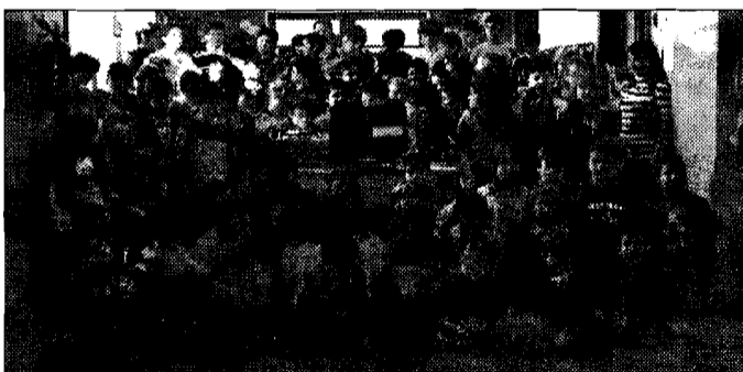
Applausi Significativo premio ai piccoli allievi

Le scuole italiane che hanno aderito, circa 620, si sono impegnate a distribuire un quantitativo minimo di reticelle di arance, 192, per raccogliere fondi e sostenere la ricerca oncologica.