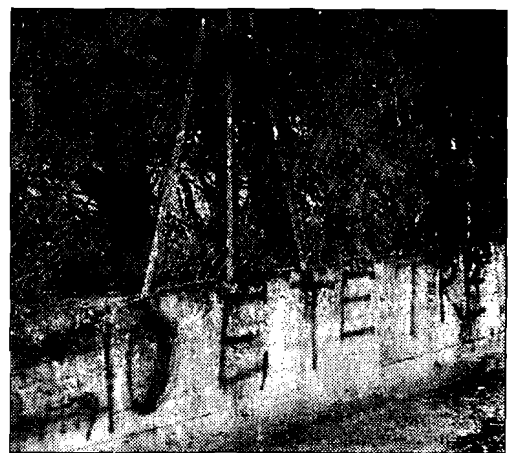
Zona pericolo Il palazzetto dello sport ha un campo pieno di siringhe e c'è anche una scuola confinante con un buco nella rete di recinzione

quella di Assisi, ma delle altre nel territorio, lavorare in sinergia e confrontarsi, impostare una strategia comune". "Ci auguriamo che questo consiglio - sostiene Travicelli del Pd - possa divenire il punto di partenza per la definizione di una programmazione organica e articolata da parte dell'amministrazione, che deve scen-