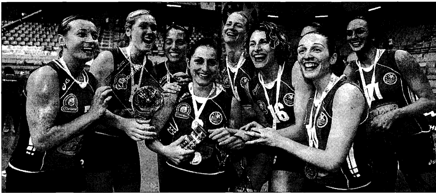
Serata da incorniciare Le ragazze della Colussi festeggiano la Champions: sono momenti di vera gioia