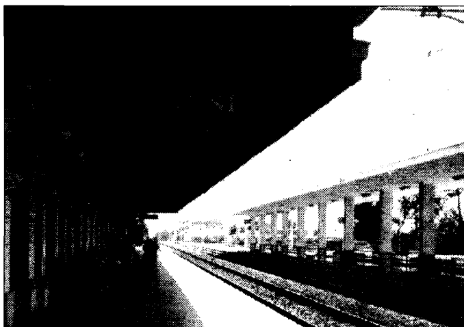
Stazione Uno dei punti al centro di polemiche e controlli

stante nella malfamata zona. Il sindaco Claudio Ricci interviene puntualmente per segnalare "l'azione incisiva" delle forze dell'ordine;