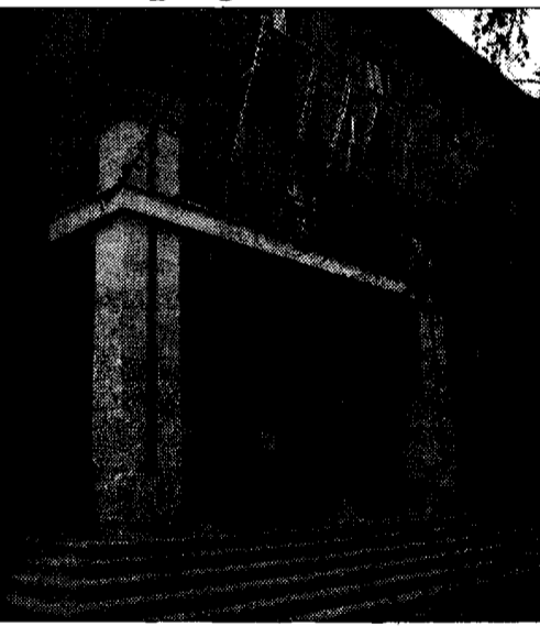
Comune Giunta Lombardi al lavoro

rispetto del patto di stabilità, è riuscito a intervenire ulteriormente sul bilancio di previsione 2008 con una manovra correttiva, come richiesto dai sindacati", si fa sapere dal palazzo del municipio bastiolo. Le correzioni al bilancio preventivo 2008 si sono aggiunte a altri provvedimenti che l'amministrazione aveva già presentato come "agevolazioni tariffarie"; per esempio la riduzione del 33,33% della Tarsu, tassa per lo smaltimento dei rifiuti solidi urbani, per tutte le abitazioni con un unico occupante residente, per tutte le abitazioni dove risiedono uno o due anziani con più di 65 anni e per quelle occupate da una famiglia con un portatore di handicap.