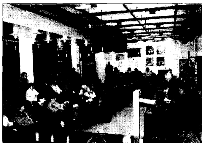
Clima rovente In Consiglio maggioranza a rischio

zione. Mentre i Comunisti italiani avrebbero avuto semplici complicazioni tecniche relativamente alla registrazione del video, "la resa dei conti che è in atto tra Ds e Margherita ha probabilmente imposto il silenzio a quest'ultimo gruppo politico - osserva Fratellini - questo perché nessuna dichiarazione influisca negativamente sulle trattative che sarebbero in corso per ristabilire i rapporti politici che permetterebbero alla maggioranza di portare avanti il consiglio comunale fino alla fine della legislatura". Se anche l'interpretazione del coordinatore di Forza Italia potrebbe essere relativamente oggettiva, vero è che sono in molti ad attendere il prossimo consiglio comunale per vedere cosa accadrà. La seduta, durante la quale si dovrebbe decidere in merito alla variazione di bilan-