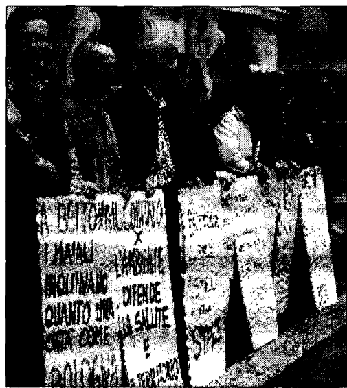
Laguna e proteste L'argomento è molto sentito dai bettonesi

nanza sindacale numero 46, è facilmente deducibile che le direttive non sono state rispettate; all'interno del nostro territorio sindacale sono infatti ancora presenti ben 25mila capi suini". A questo punto, il gruppo della lista civica del Ponte ha ricordato all'assessore all'ambiente che all'amministrazione, come spetta l'autorizzazione per l'allaccio degli allevamenti all'impianto di proprietà comunale, così dovrebbe competere la chiusura dei rapporti con gli allevamenti che non sono in regola; il che è già avvenuto con una recente delibera di giunta che ha chiuso il servizio nei confronti di alcuni allevatori di fuori Comune.