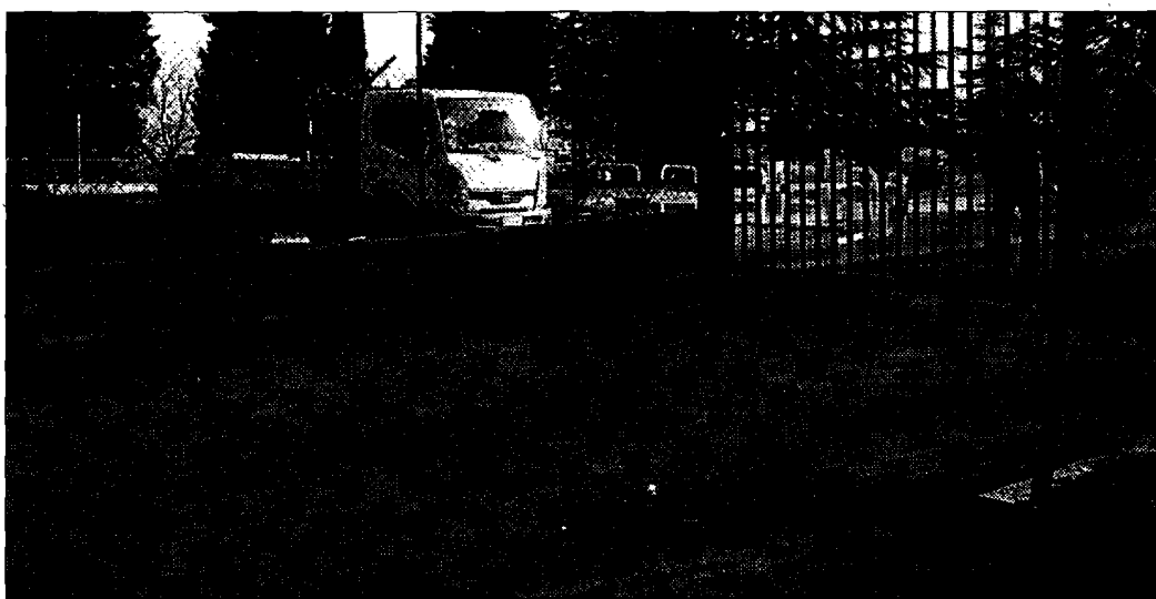
Parcheggio E' al Serafico in attesa della ristrutturazione di San Pietro