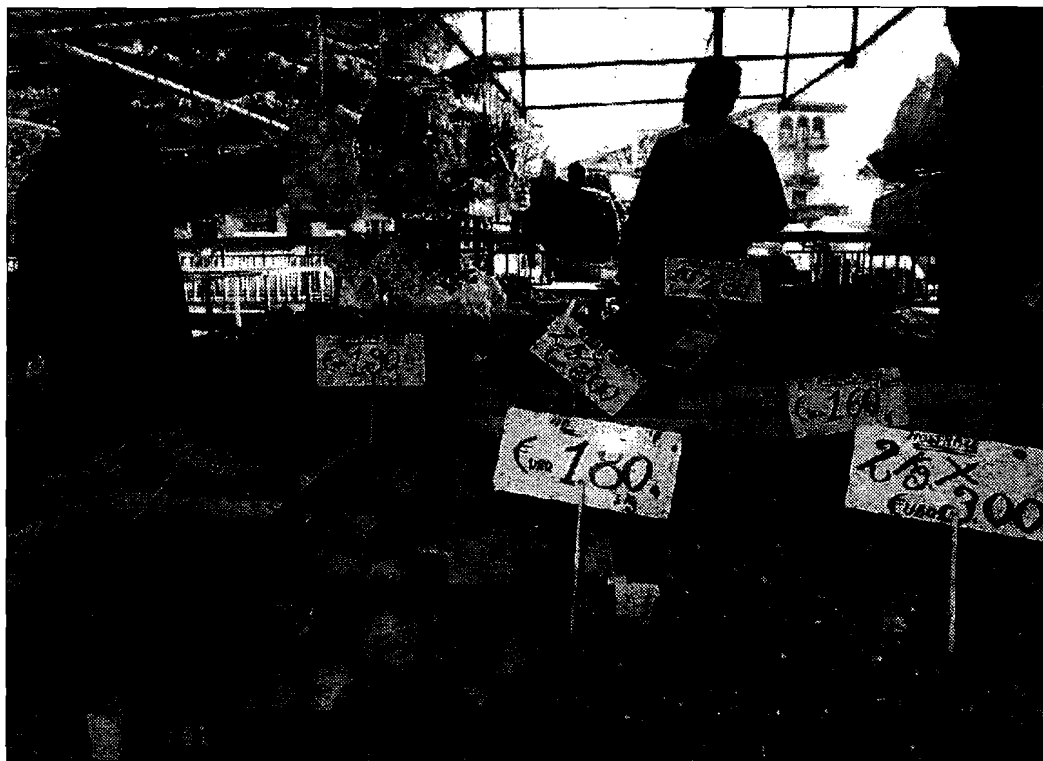
Occhio al portafoglio Consumatori nella morsa dei prezzi di frutta e verdura

E se da una parte i consumatori continuano a suonare la carica contro aumenti indiscriminati dall'altra anche Confartigianato fa un'analisi sull'inflazione. "I dati