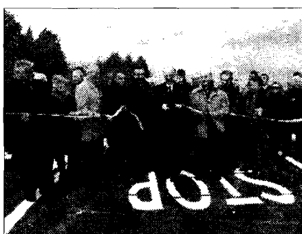
Particolare il taglio del nastro

Numerosi i rappresentanti dell'amministrazione