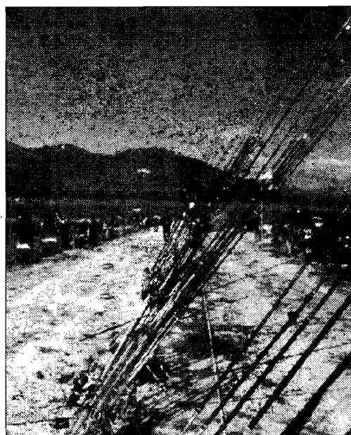
Ai laghi di Faldo Il 29 e 30 marzo prossimi