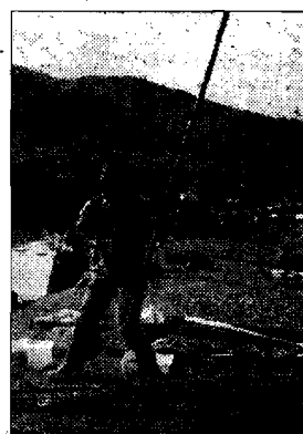
Spettacolo ai Faldo

Utilizzati persino galleggiante e il vetro