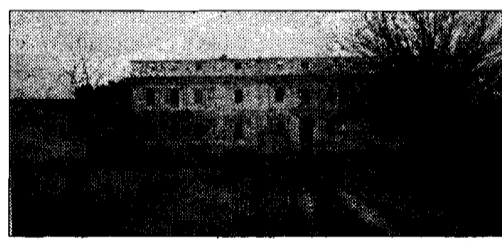
Monumento Villa settecentesca abbandonata

BETTONA (a.g.) - Novità in materia di lavori pubblici, mentre il comitato popolare per l'ambiente lancia un appello per il recupero dei siti storici del comune. "Il convento di Santa Caterina e quello di Sant'Antonio sono in attesa di essere completamente qualificati, uno da quarant'anni, l'altro da venti; le chiese di Sant'Onofrio, San Quirico, la compagnia della Morte e quella di San Crispolito urgono interventi di recupero; la villa settecentesca del Boccaglione è un monumento in stato di semi abbandono". Queste sono le denunce del comitato,