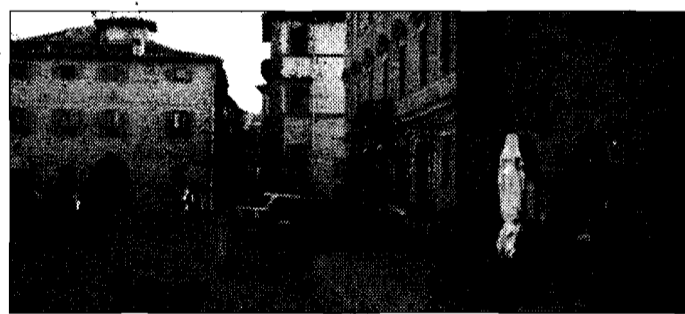
Centro La piazza del paese che punta al rilancio