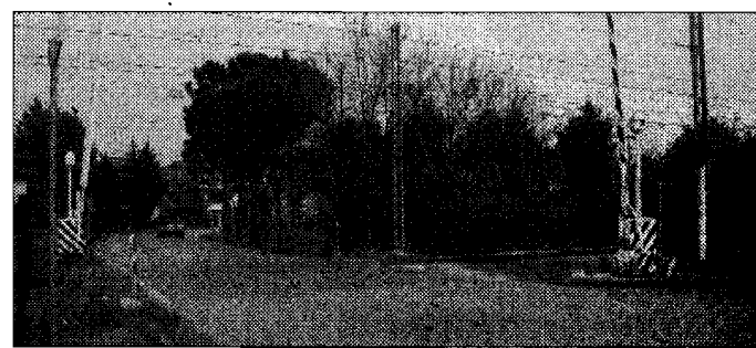
Sottopasso San Rocco Il sindaco respinge le accuse