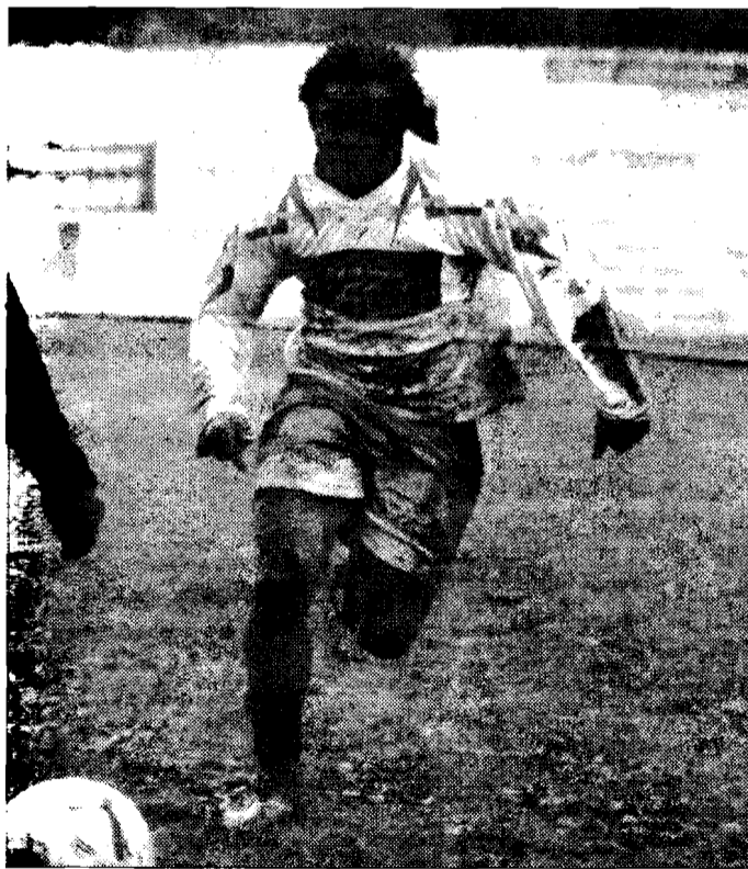
Il Bastardo è in festa Omgba ha trovato la via del gol