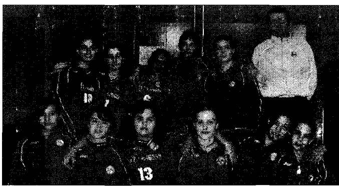
La formazione dell'Under 14 della Brunelli

NOCERA UMBRA - La 12ª giornata di andata del campionato di volley femminile di serie A2, propone la Brunelli Nocera in trasferta in quel di Roma all'impianto sportivo PalaFonte di via Meldola, contro la squadra capitolina attualmente posizionata nella media classifica del campionato di A2. Nella squadra romana militano alcune vecchie conoscenze per la Brunelli affrontate da avversarie nella passata stagione come per esempio la centrale Viviana Corvese l'alzatrice Elena Drozzina, la centrale Chiara Carminati, e la schiacciatrice Melissa Donà e l'ungherese Marianna Nagi giocatrici che possono sicuramente fare quel qualcosa in più che necessita ad una formazione costruita per occupare le prime posizioni della classifica. Se attualmente le romane non sono in veste di prime donne lo devono ad una partenza non proprio brillante di campionato infatti le prime partite sono state un po' deludenti ma ora sembrano