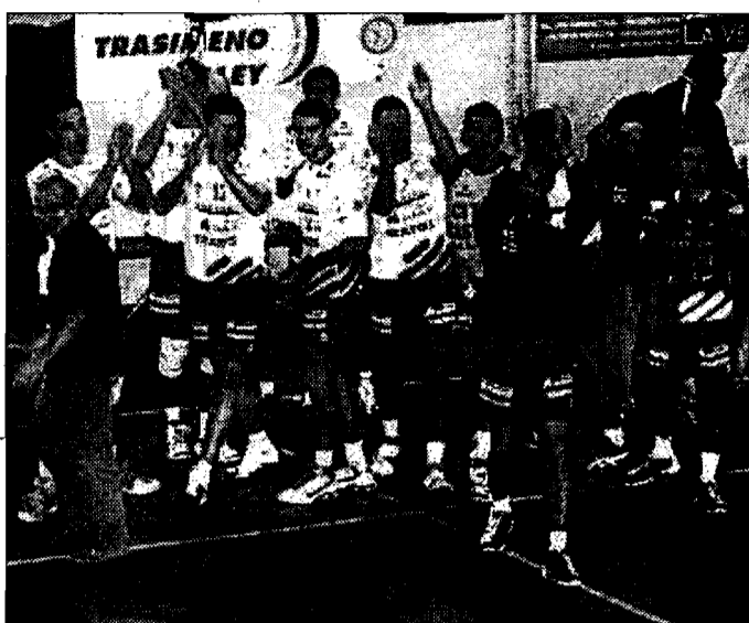
In campo La Gherardi vuole festeggiare anche stasera