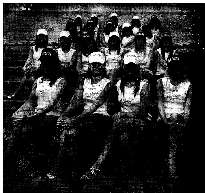
Le protagoniste Le 20 finaliste salite in passerella

Sono ternane le miss Eleganza, Cinema e Wella