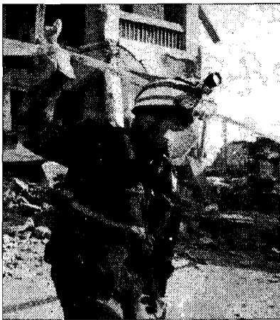
Rischio sismico alto in Italia

L'iniziativa si è svolta ieri a Perugia, nell'ambito delle iniziative organizzate in occasione del decennale del sisma che colpì Umbria e Marche. E' stata concepita, come molte altre che si svolgono in questi