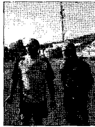
La squadra è motivata e da completare